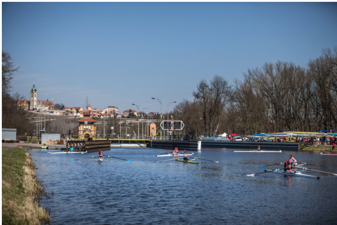
Dojezd MČR na dlouhé dráze v Hoříně u Mělníka 2018