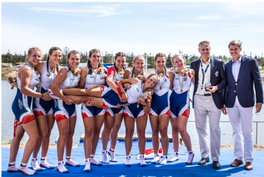
Vítězná osmiveslice junierek z MSJ 2018 v Račicích.