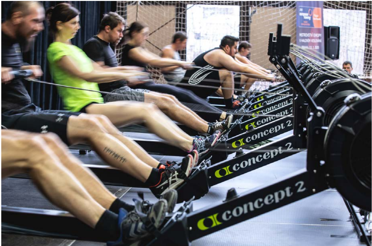
Závod amatérů při Festivalu halového veslování.