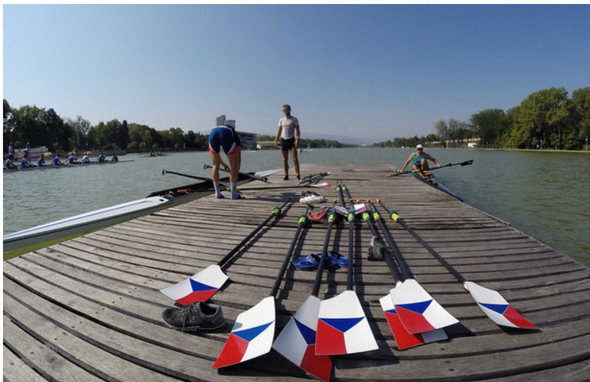
Naše barvy na MS 2018 v bulharském Plovdivu