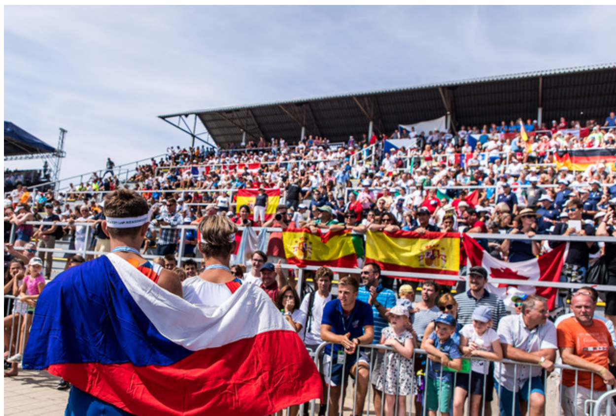
Divácká kulisa při MSJ 2018 v Račicích