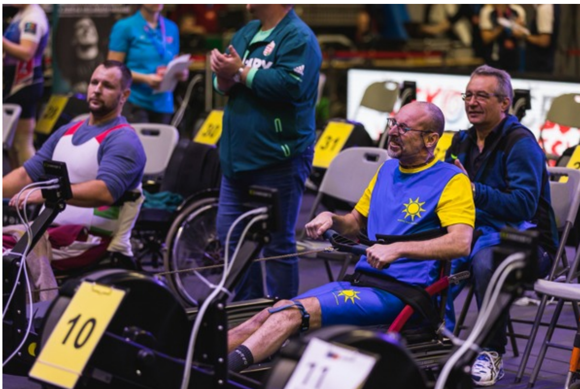
Momentka z ME v halovém veslování v lednu 2020 v Praze

Zpracoval: Petr Janák , předseda Komise handicapovaných veslařů ČVS