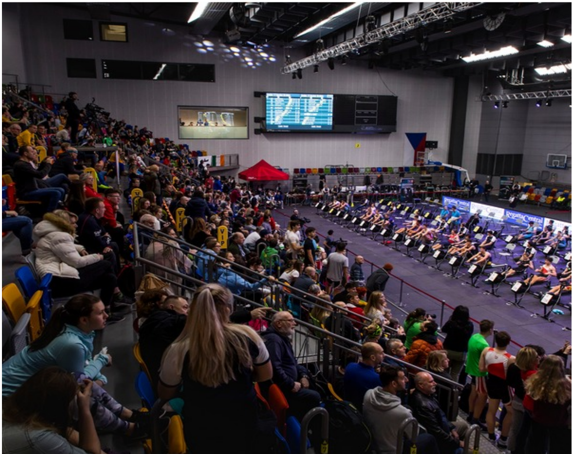
Plná tribuna při Halovém ME v Praze v lednu 2020

Zpracovala: Slávka Kouřilová , předsedkyně Kontrolní komise ČVS, 30. 4. 2021