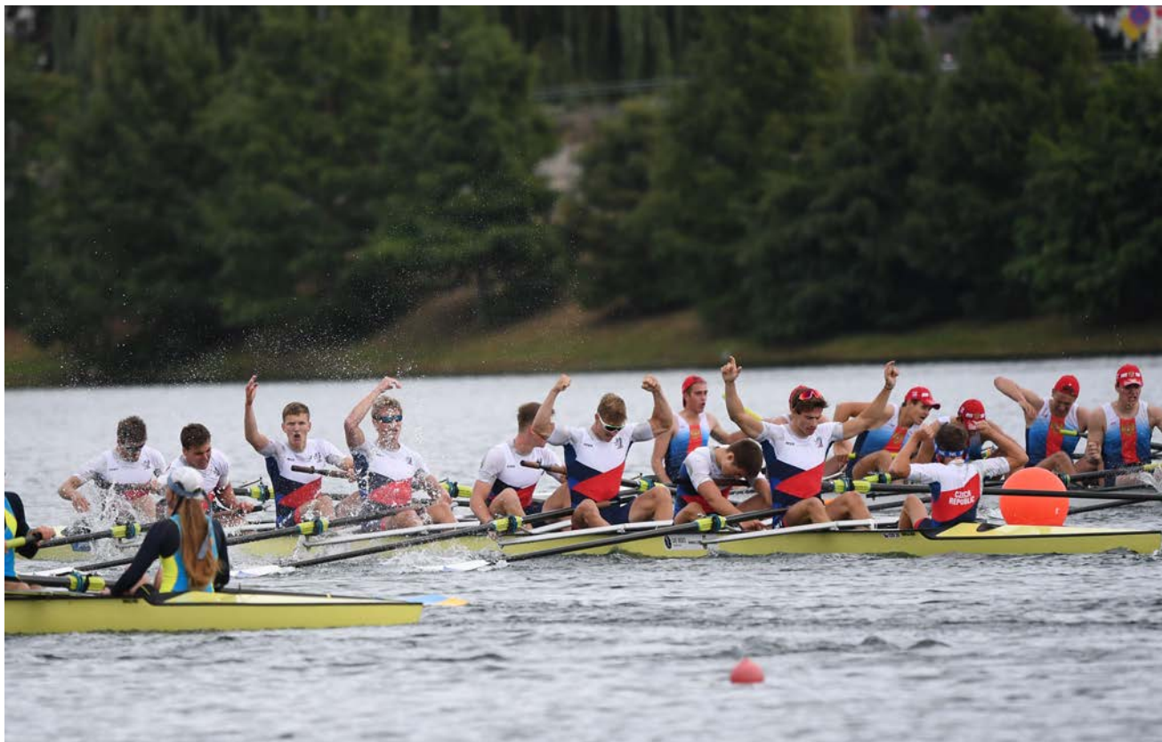
Stříbrná osmiveslice juniorů