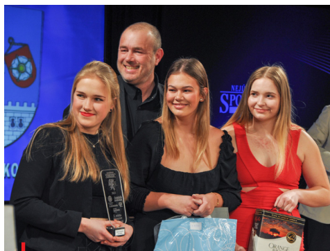
Nejlépeším kolektivem Strakonicka se staly vodní pólistky TJ Fezko Strakonice