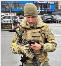
Tenista Serhij Stachovskij na kontrolním stanovišti